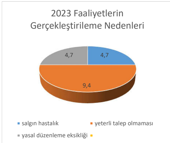
Şekil 2.2019-2023 Stratejik Planında Yer Alan Faaliyetlerin Gerçekleşme Durumu

1 faaliyetin (%4,7) için salgın hastalık nedeniyle, 2 faaliyetin (%9,4) yeterli talep ve katılımın olmamasından, 1 faaliyetin (%4,7) yasal düzenleme eksikliğinden gerçekleştirilemediği görülmektedir.