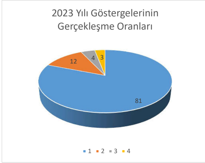
Şekil 1.2019-2023 Stratejik Planındaki Göstergelerin Gerçekleşme Durumu

Grafiğe göre performans göstergelerinin % 81'inde 2023 yılı hedeflerine büyük oranda ulaşılmış ya da hedefler aşılmıştır. Göstergelerin % 12'sinde ise 2023 hedefine yakın makul artışlar kaydedilmiştir. % 4'ünde 2018 yılına göre ilerleme sağlanmakla birlikte hedeften uzak bir görünüm sergilenmiştir. Göstergelerin yine % 3'ünde ise 2018 yılına göre gerileme gözlenmiştir. 2018 hedefinin altında kalan göstergelerin gerilemesinde Covid-19